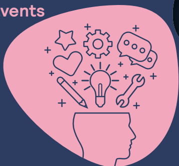
Viden & inspiration "Månedens fokus"