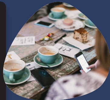
Cocuura & Friends