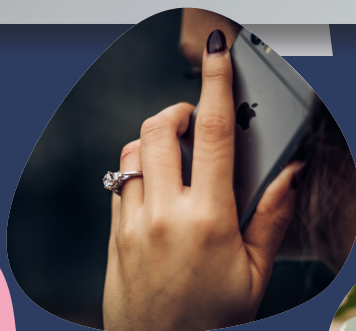
Direkte 1:1 sparring