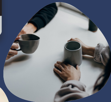
Team sparring (tilkøb)