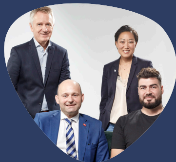
Cocuura & Livets krøllede vej talkshow