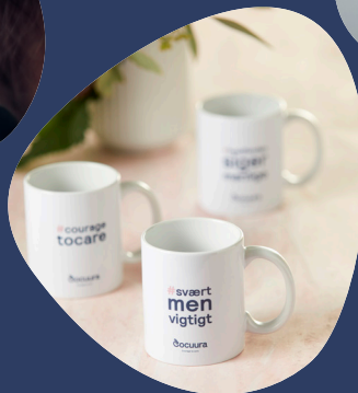
Statement produkter (tilkøb)